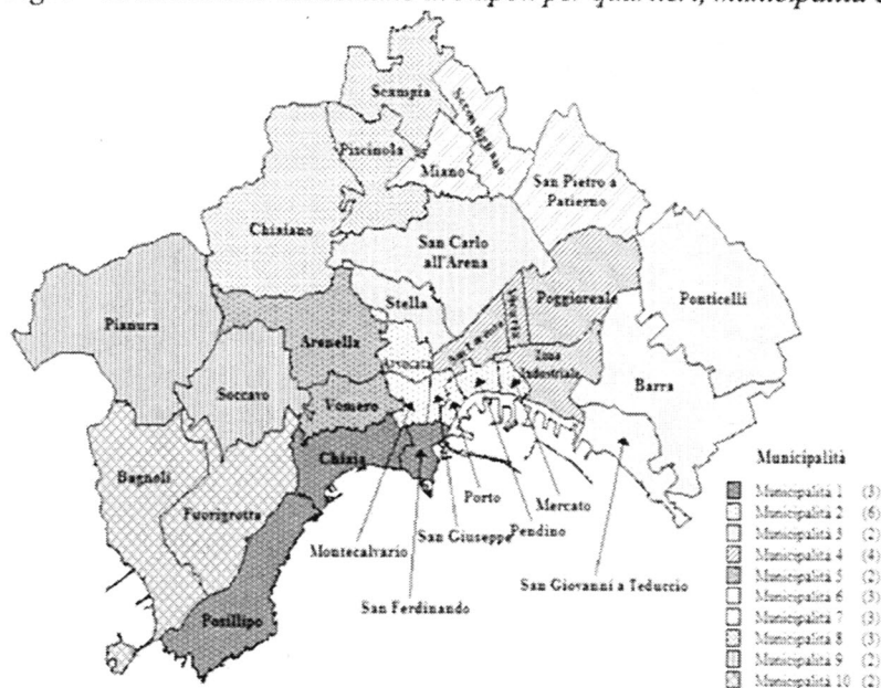
Fig. 1 – Articolazione del comune di Napoli per quartieri, municipalità e macro-aree

Nota: Centro storico = Chiaia, San Ferdinando, Mercato, Pendino, Avvocata, Montecalvario, Porto, San Giuseppe, San Carlo all'Arena, Stella, San Lorenzo e Vicaria; Collina = Vomero e Arenella; Est = Poggioreale, Zona industriale, Ponticelli, Barra e San Giovanni a Teduccio; Nord = Miano, Secondigliano, San Pietro a Patierno, Piscinola, Chiaiano e Scampia; Ovest = Posillipo, Soccavo, Pianura, Bagnoli e Fuorigrotta.